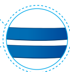
Cinturones que garantizan la fortaleza del tanque